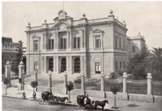
Fachada principal del Banco Provincia de Buenos Aires. Fuente: Archivo y Museo Históricos del Banco de la Provincia de Buenos Aires "Dr. Arturo Jauretche" – 1914.