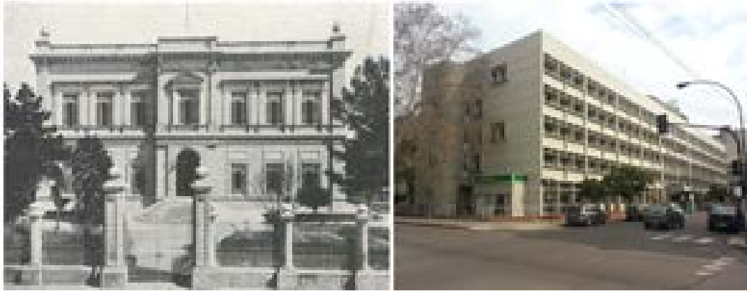
Composición de situaciones de la fachada calle 6. Original y actual. Fuente: Archivo y Museo Históricas del Banco de la Provincia de Buenos Aires “Dr. Arturo Jauretche” – 1914. Composición: Arq. María Belén de Grandis.